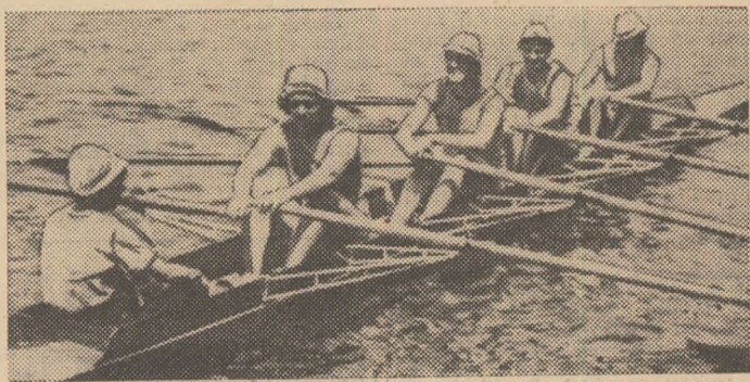
Echipajul românesc de schif 4+1 visle a cucerit două victorii în „Regata Snagov“ la canotaj feminin.

Profilind de timpul excelent de concurs, participantele la ediția 1976 a „Regatei Snagov“ la canotaj au oferit și simțată publicului prezent în tribunele din vecinătatea turnului de soșire posibilitatea de a urmări curse deosebit de spectaculoase. Canotoarele din lotul olimpic al României au realizat în această a doua zi a întrecerilor o dublă performanță: ele au reeditat succesele din prima zi, câștigând din nou cinci din cele șase finale și, în plus, au obținut timpi foarte buni. Dar să trecem în revistă, succint, finalele de simbată: