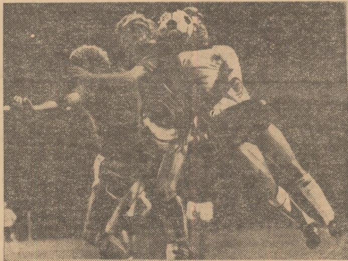
Moment dramatic în finala C.E. de la Belgrad: Hölzenbein (R.F.G.) aduce în min. 90, printr-o lovitură cu capul, egalarea. Este 2-2 și urmează prelungirile...

Cea de-a 5-a ediție a campionatului european de fotbal s-a încheiat, duminică seara, la Belgrad, cu victoria echipei Cehoslovaciei: 7-5 (2-1, 2-2, 2-2), după o partidă pasionantă. Spre deosebire de partidele din semifinale și, apoi, de meciul pentru locul 3, care — toate — au fost decise în prelungiri, finala dintre echipele Cehoslovaciei și R. F. Germania a oferit un plus de atracție, pentru că, după cele 120 de minute epuizante, au urmat loviturile de la 11 m, numai în urma cărora au fost desemnați învingătorii! Să recapitulăm, însă, evoluția scorului. După 23 de minute, Cehoslovacia conducea cu 2-0 (Svehliș și Dobias), apoi vest-germanii au re-