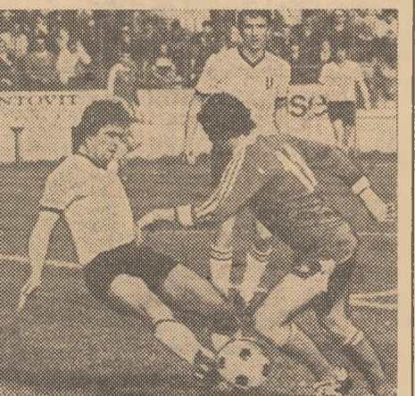
Cluj-Napoca nu și-a făcut iluzia că va recupera totocmai în meciul cu Steaua, de la București, atîm imaginea unui frumos duel între Porățchi (f. Punctele de acasă au fost hărăzitoare...