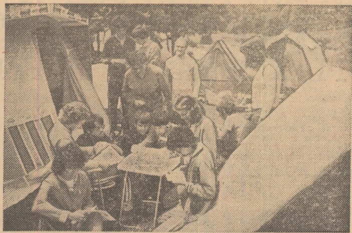
Echipajul clubului Voința Brașov studind harta înainte de plecarea pe traseu.

ediție a Balcaniadei, este entuziasmat de poziția poligonului pentru talere. „Sper — ne spunea luni dimineață — să obțin aici cele mai bune rezultate din cariera mea”. Decanul de vîrstă al lotului, Nicolae Rotaru, demonstra cu argumente de luat în seamă că la probele de pușcă întrecerea va fi extrem de echilibrată. Că pe distanța unui... punct se vor înșirui 8—10 concurenți. „Va cîștiga — conchidea experimentatul sportiv — acel concurent care va reuși să se acomodeze cel mai bine cu particularitățile poligonului, cu condițiile specifice momentului. Aș vrea să realizez un rezultat cît mai apropiat de acel 600 de puncte, recordul meu la armă liberă, 60 focuri”.