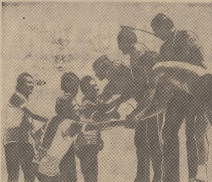
Pe podiumul olimpic, cicliștii sovietici și polonezi se felicita reciproc pentru medaliile olimpice de aur și, respectiv, de argint cucerite în proba de 100 km. Contratimp pe echipe.