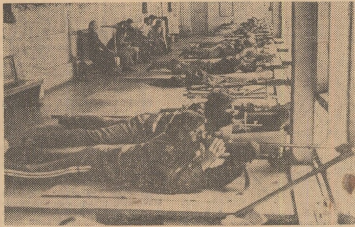
Concurs de tir pe poligonul din parcul sportiv Dinamo. Majoritatea concurenților sînt juniori și țintesc... performanța record.