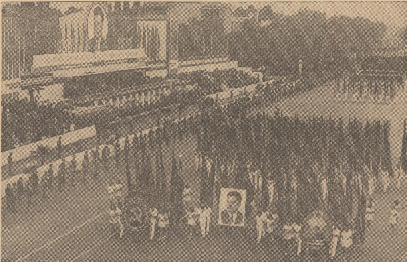
Prin fața tribunei oficiale trec primele rinduri ale coloanelor celor 8 000 de sportivi

În prezența tovarășului Nicolae Ceaușescu, secretar general al Partidului Comunist Român, președintele Republicii Socialiste România, a avut loc luni, 23 August, demonstrația oamenilor muncii cu prilejul celei de-a XXXII-a aniversări a eliberării României de sub dominația fascistă.