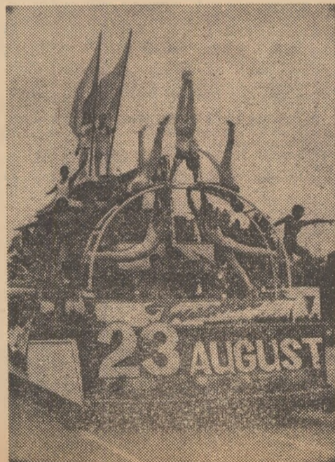
Car alegoric al victoriilor spor- tive

Ieri a început contratimpul juniorilor mari, care urmează să-și desemneze cîștigătorul în gala de astăzi, de la ora 18, cînd se va disputa și cursa de 500 m cu start de pe loc — juniori mici. Mîine, de la aceeași oră, cursa de urmărire individuală — juniori micl (m. c.).