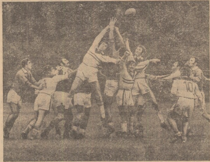
Luptă aeriană pentru balon, eșec pentru dirzenia cu care s-a jucat în meciul Grivița Roșie — Gloria Buzău.

● OLIMPIA: VICTORIE ÎN EXTREMIS! Lovitură de teatru, simbatică, pe „Olimpia“. După ce a condus până în min. 79 cu 10-9, Gloria București a cedat cu puțină secundă înaintea fluierului final în fața echipei Olimpia, prin încercarea lui Slăvuteanu, care a „întors“