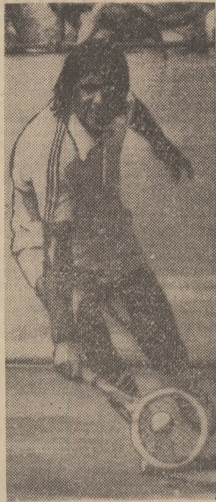
Ilie Năstase, pe terenurile de la Forest Hills

Stone, Ruffles — Smith, Lutz 6-3, 3-6, 6-4; Hewitt, McMillan — Stockton, Tanner 6-2, 6-2; sferturi de finală: Ries-