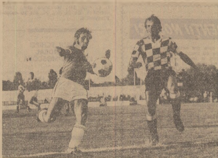
Marinescu va reuși să șuteze la poartă, sub privirile adversarului său (C.S.U. Galați — Boavista Porto)

Startul „pe cinci fronturi” al echipelor noastre de club în prima manșă a celui de-al tur din