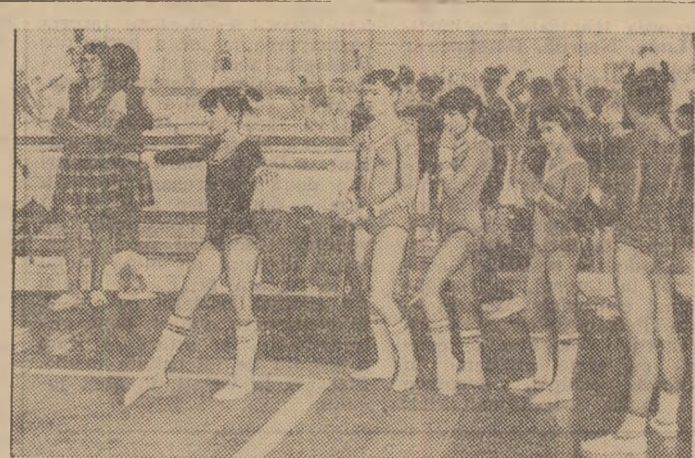
Noul ciclu olimpic a început! Semnalul a fost dat de gimnastică, prin concursul de selecție desfășurat în urmă cu citva timp în Capitală, unde am surprins acest aspect

Deci, extinderea profilării sportive a județelor țării este o măsură care va conduce, în mod indiscutabil, la creșterea valorii generale a sportului românesc, la mai puternică sa afirmare pe plan internațional.