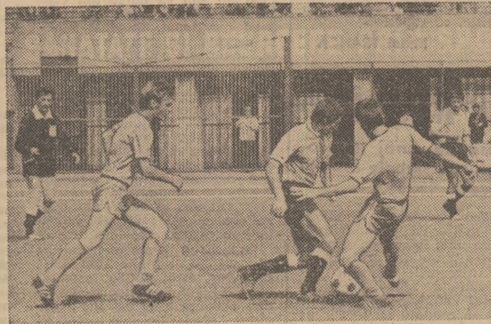
O fază din partida Sportul studențesc — Politehnica Iași (0-1), disputată într-una din etapele trecute ale Diviziei de juniori.

POLITEHNICA IAȘI (antrenor — Kurt Gros) — PROGRESUL BUCUREȘTI (antrenor — E. Iordache) 1-0 (0-0). Joc dirz, cu numeroase neregularități, mai ales în prima repriză, sub privirile îngăduitoare ale arbitrilor V. Popovici (Botoșani). În min. 10, Pirvu (Progresul) a lovit intenționat pe fundașul Cojocaru, pentru ca după citeva minute Cojocaru să lovească un adversar, dar ambii au fost sancționați cu