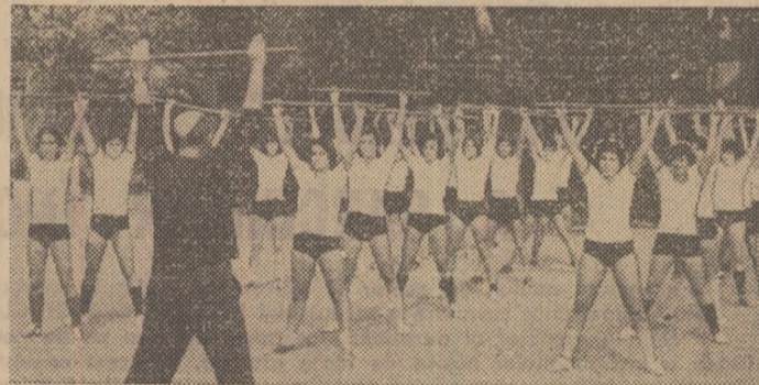
Elevii de la Liceul „Gh. Șincai” la prima lor oră de educație fizică în noul an școlar.