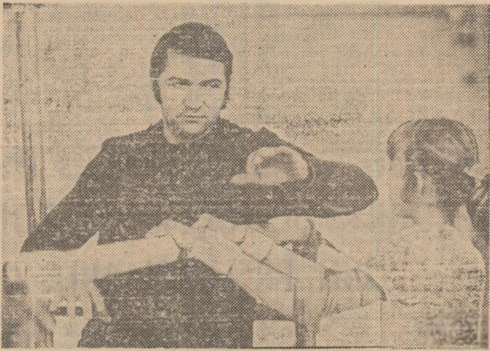
Bela Karoly asemenea unui mare dirijor...

Priveam în sală tăcuți, cu respect față de tot ceea ce vedeam la antrenamentul condus de Bela Karoly. Sentimentul de stimă îl impunea truda care modela pînă la perfecțiune