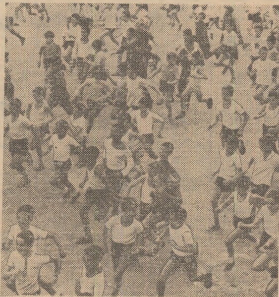
Alergările de cros, îndrăgite de copii și pionieri, se vor integra în programul de activități sportive al tuturor școlilor generale.

Baza organizatorică a activităților sportive pionierești rămîne deosebit de unitară și de pionieră. Este vorba de o activitate sportivă cu caracter de sistem și cu perspectiva esalonată pe structura anului de învățămînt, cu ponderea pe zilele de la sfîrșit de săptămîin și pe vacanțele școlare. Este vorba, în același timp, de o activitate sportivă dinamică, interesantă și plăcută, pe gustul și după preferințele marii mase a prac-