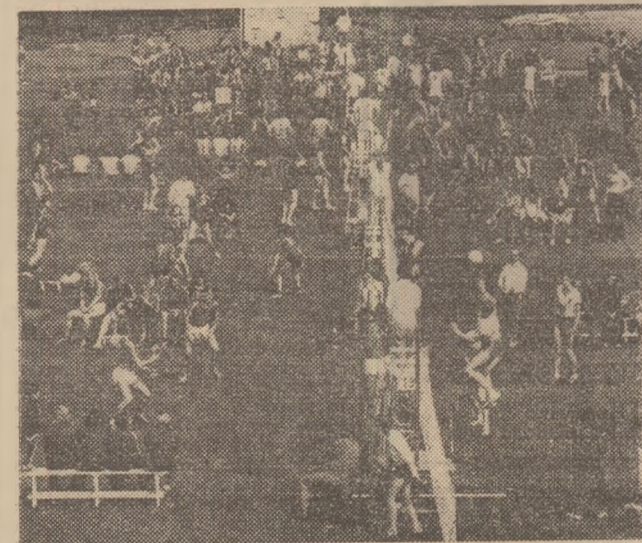
Meciurile de volei, în cadrul competițiilor sportive de masă, cunosc o deosebită amploare.

redactor șef al ziarului „Deutsches Sportecho” — Berlin