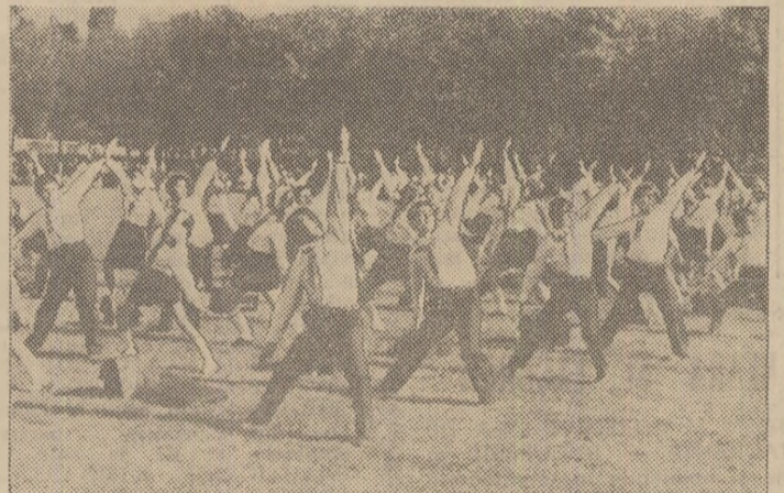
Micii purtători ai cravatelor roșii cu tricolor, mari iubitori ai exercițiului în aer liber