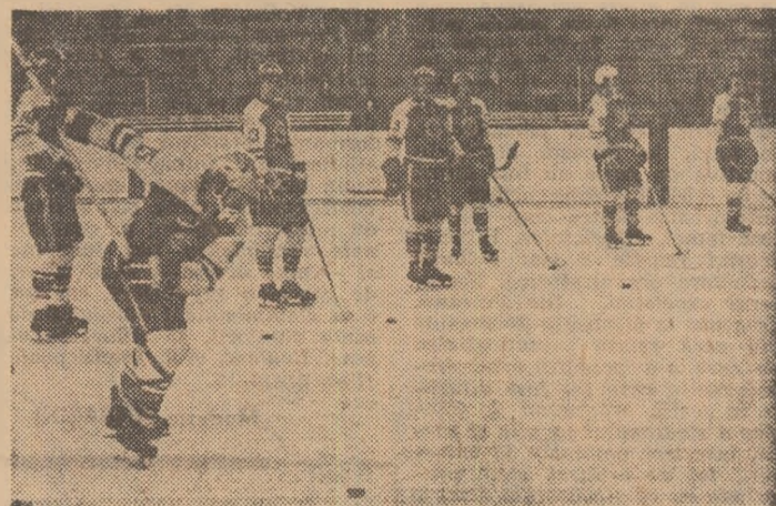
Dinamoviștii la unul din ultimele lor antrenamente

STEUA (deținătoarea trofeului), DINAMO (eterna ei rivală), SPORT CLUB MIERCUREA CIUC și DUNAREA GALAȚI (cu loturi considerabile întinerite) sînt cele patru formații care își vor disputa