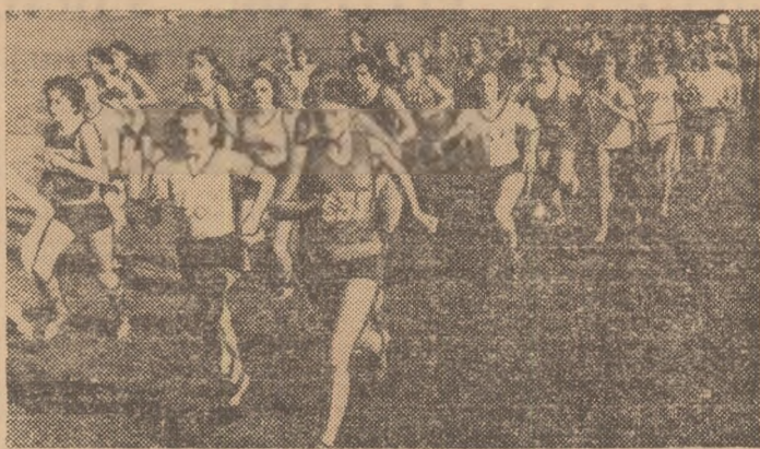
Secvență din proba de cros a „zonei“ sibiene a juniorilor I în care participantele au fost în proporție de 80 la sută eleve...