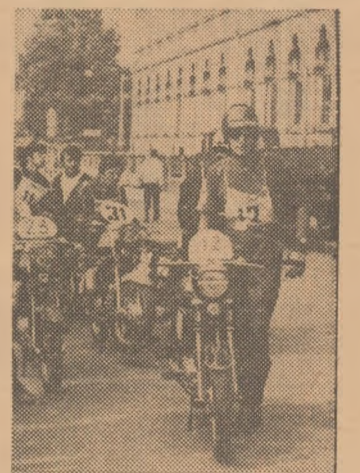
Concursurile rezervate posesorilor de motorete „Mobra” ciștigă tot mai mulți adepți. În fotografie, un grup de alergători așteptând startul într-o cursă de regularitate și rezistență

Participanții vor trebui să poarte obligatoriu casca de protecție. Ei vor efectua un slalom, asemănător celui de la examenul de conducere auto, precum și două opriri în casetele indicate de arbitri. Cei mai buni alergători vor participa apoi la un nou test de îndeminare, după aceleași reguli, după desemnarea învingătorilor la clasele respective. Se alcătuiesc clasamente individuale și pe echipe de sector sau întreprinderi. Până la locul 10 se vor acorda premii și diplome. Primul start se va da la ora 9.