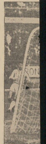
In cădere, portarului C...