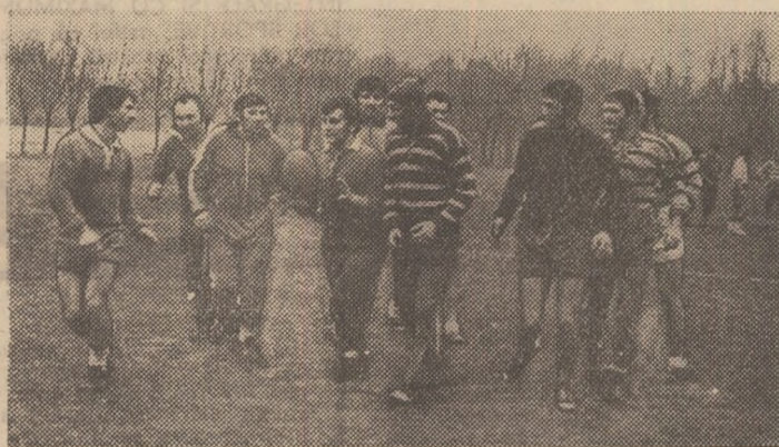
Oaspeți ai dimineții, pe stadionul Tineretului — rugbystii de la Gloria.

secției dinamoviste. Cei mai numeroși oaspeți ai complexului au fost, în dimineața vizitei, fotbalisții de la grupele de copii ale antrenorilor Frățilă, Ivan și Timar, care au ocupat