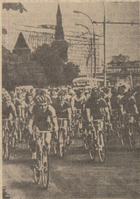
Cursa ciclistă de fond din cadrul Olimpiadei '80 va trece prin centrul capitalei sovietice.

Conferință de presă la sediul Comitetului de organizare a J. O. '80