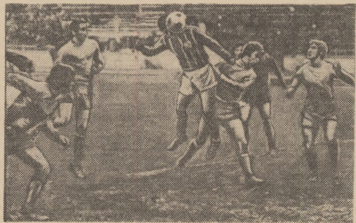
Min. 84 : Dragu înscrie spectaculos, deschizînd scorul în partida Progresul — F.C. Corvinul.

bativitatea specifică vîrstei pe care o au? După etapa a 14-a — o etapă nesatisfăcătoare — campio- natul nostru se intrerupe pen-