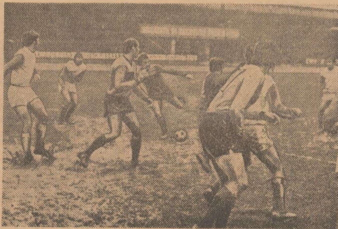
O. Ionescu (Sportul studențesc), șutează la poarta băcăuanilor.