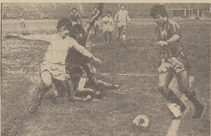
Iată una dintre puținele „mostre” de angajament fizic oferit de jucătorii echipelor Progresul și F.C. Bihor, care au depus un mare travaliu, pe un teren greu, în confruntarea lor directă din ulti- ma etapă a turului campionatului

Au reușit echipele noastre, pe parcursul turului campiona- tului recent încheiat, să aibă o capacitate de efort corespun- zătoare? DUPĂ ASPECTUL CALITATIV MODEST (CU U- NELE MICI EXCEȚII) AL MA- JORITĂȚII PARTIDELOR, SE