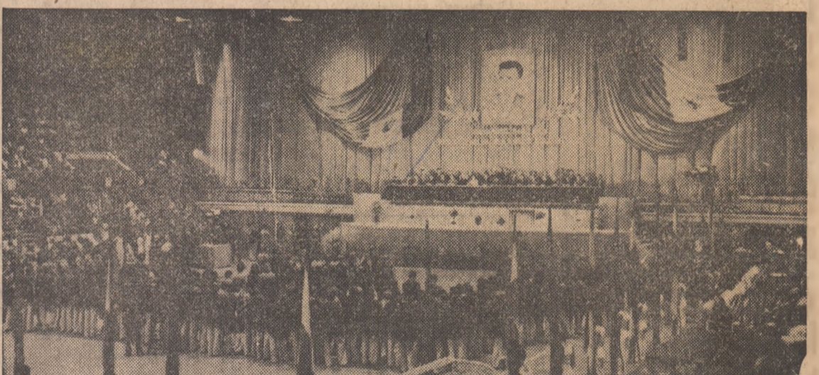
Aspect de la marea sărbătorire a medaliaților olimpici (19 august 1976)