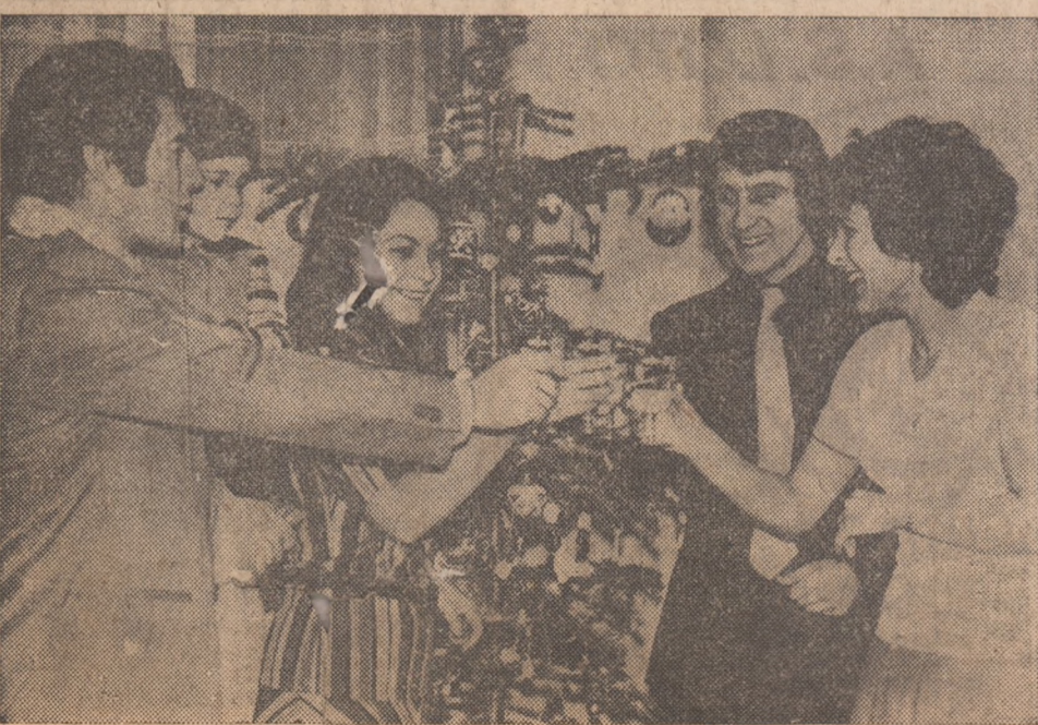
BUCUREȘTI. — Familile hocheiștilor Pană și Gheorghiu închină tradiționalele pahare cu șampanie pentru debutul echipei României în elita hocheiului mondial.