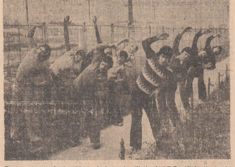
Pentru tinerii de la Căminul de nefamilisti al I.T.B. (Colentina) ziua începe cu gimnastică de învîrtare