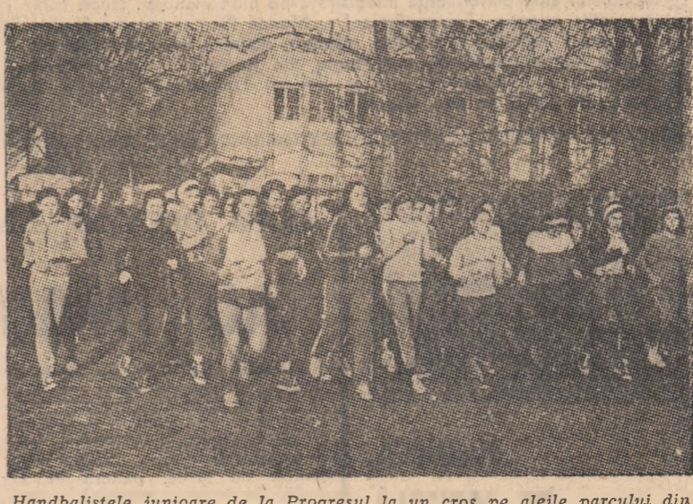
Handbalistele junioare de la Progresul la un cros pe atelele parcului din Cotroceni.

din incinta parcului Progresul, precum şi - mijloc de mult cunoscut, dar întotdeauna eficient - treptele „centralului” de tenis. În sfîrşit, am alcătuit un circuit pe atelele parcului - conșiderînd că o mare parte a pregătirii fizice trebuie să se desfășoare într-un cadru natural, atrăgător - apropiînd condiţiile