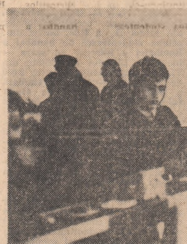
Sala de tir, pentru arme cu aer comprimat, din parcul sportiv Dinamo, unde se vor desfăşura şi întrecerile „Cupei Independenţei”