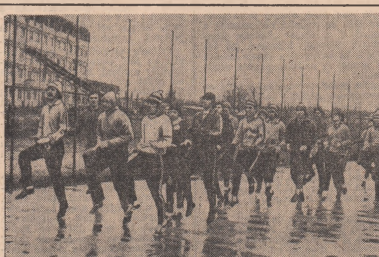
După ce s-au prezentat aspecte de la antrenamentele celorlalți patru divizionari...