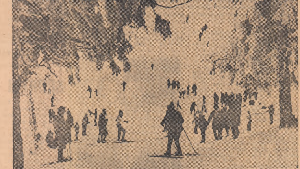
Cu schiurile, la sfîrșit de săptămînă, în splendidul decor de iarnă al Postăvarului

5. ASTĂZI, CITEVA CONCLUZII LA ÎNTREBAREA „CE ÎNTREPRINDEȚI PENTRU DEZVOLTAREA ACTIVITĂȚII DE EDUCAȚIE FIZICĂ?” CARE SUBLINIAZĂ NECESITATEA UNOR PREOCUPĂRI CRESCUTE, A UNOR MĂSURI ȘI ACȚIUNI PRACTICE PENTRU ÎMBUNĂTĂȚIREA MUNCII ÎN ACEST IMPORTANT DOMENIU