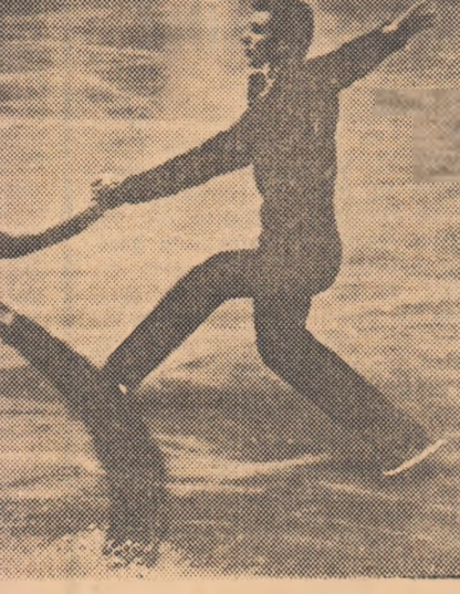
Vor fi revăzuți la apropiatele campionate europene de patinaj-artistice: Irina Rodnina și Aleksandr Zaitjev, multipli campioni ai marilor competiții ale gheții