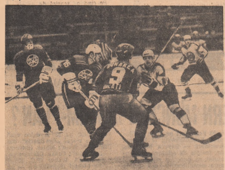
Una din partidele echilibrate ale turului precedent a fost și aceea dintre Dinamo și Dunărea Galați (4-0), din care vă prezentăm o imagine

Programul de azi, ora 16: Dunărea — Dinamo, ora 18:30: S.C. Miercurea Ciuc — Steaua; mine, ora 16: Dunărea — S.C. Miercurea Ciuc; ora 18:30: Dinamo — Steaua.