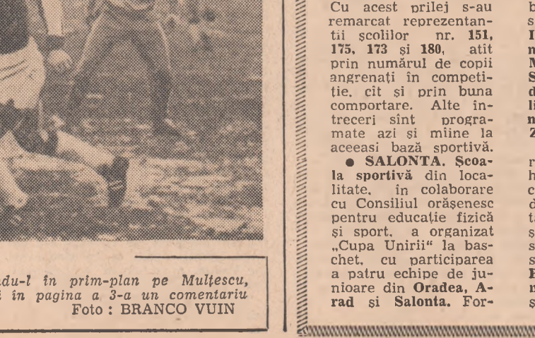
Imagine din meciul de verificare a Lotului reprezentativ, avându-l în prim-plan pe Mulfescu, al cărui „start timișorean” confirmă buna comportare din toamnă. Citiți în pagina a 3-a un comentariu pe marginea primului test al selecționabililor.