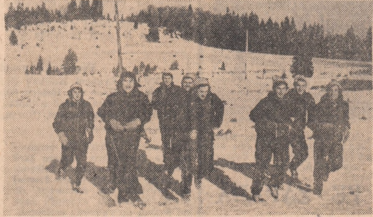
Jucătorii echipei Steaua urmă pe pantele Poienii Brașov. O vor face, în primăvară, și în... clasament pentru recîștigarea poziției de campioni?

Antrenorul principal ar mai fi vrut să spună, desigur, că pînă la reîntoarcearea jucătorilor selecționați (cu numai 12 zile înainte primul meci oficial) nu are la dispoziție decât echipa celor 11 de aici și că pe acestă va trebui să-i pregătească