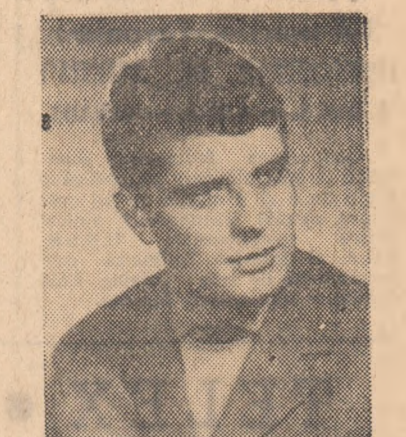
poate scăpa echipei C. S. Tirgoviște, care mi s-a părut a fi cel mai bine organizată în joc.

sarcinile de joc pe care le primesc. Deci explicațiile ascensiunii noastre sînt: întînțirea echipei, munca și disciplina.