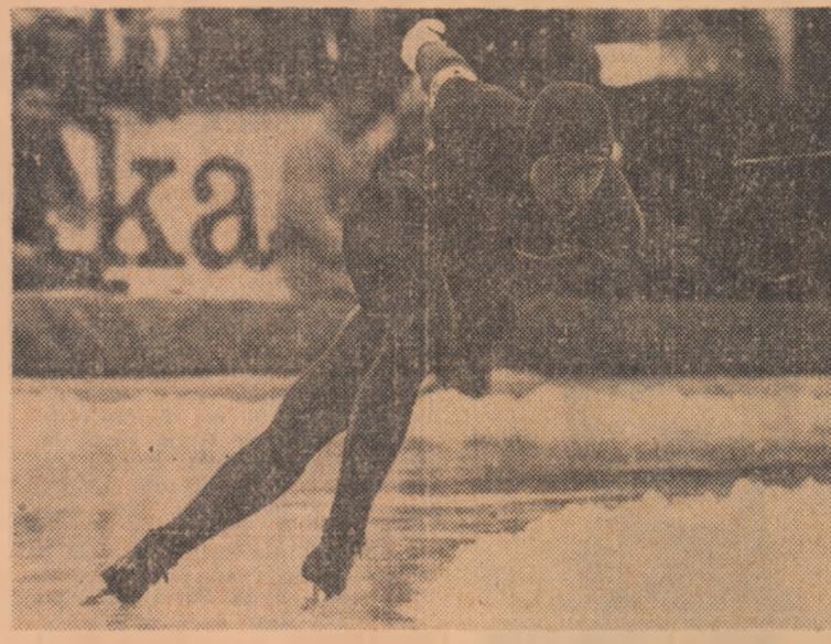
Ținărul patinator norvegian Amund Sjøbrend, unul din favoriții campionatului mondial

Cunoscuta stațiune elvețiană de sporturi de iarnă a mai găzduit de multe ori marea confruntare a patinatorilor — prima oară chiar în 1898, asadar este obișnuită cu astfel de organizări. De altfel, concurenții transceanici și-au făcut pregătirile la începutul sezonului