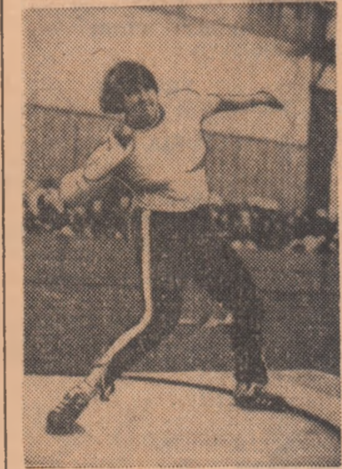
În prima zi a concursului din sala olimpică budapestană, Helena Fibingerova (Cehoslovacia) a reușit noul record mondial la aruncarea greutății: 21,66 m.

În ultima zi a concursului atletic de sală de la Budapesta, Veronica Buia a cîștigat proba