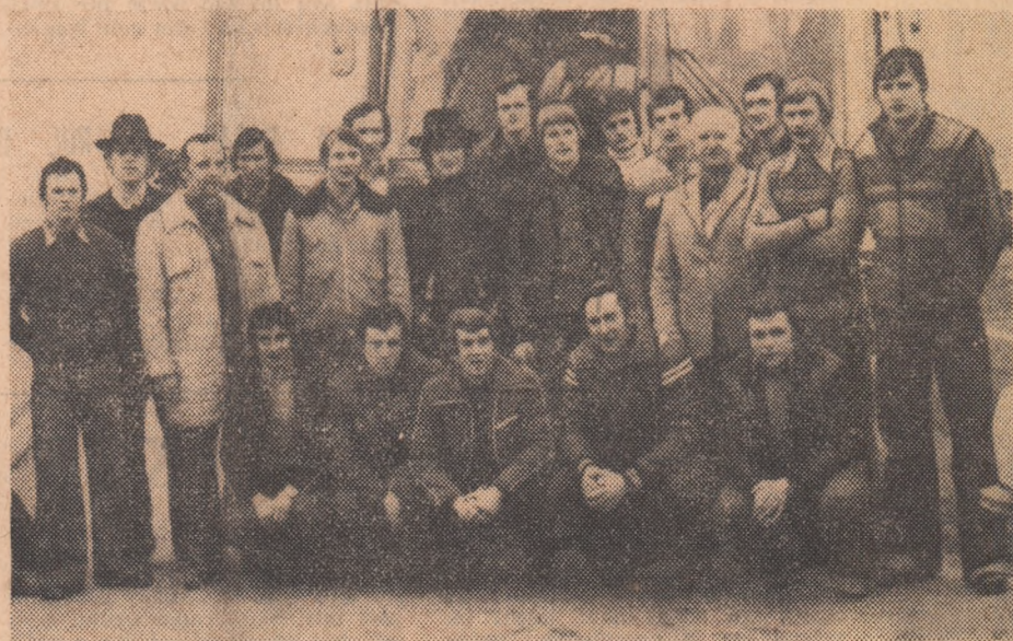
Hocheiștii din R.D. Germană, la cîteva momente după sosire, ieri, pe aeroplanul internațional Otopeni.

Tradiționala dublă întîlnire dintre selecționatele de hochei pe gheață ale României și R.D. Germane se va consuma în acest sezon puțin mai tîrziu decît de obicei. Adică, în loc de primele zile ale lunii decembrie, așa cum s-au desfășurat majoritatea confruntărilor precedente, acum cele două jocuri dintre cei mai buni hocheiști din România și R.D. Germană se vor disputa în mijlocul lunii februarie, mai precis astăzi și mine, de la ora 17.30, pe patinoarul „23 August” din București.