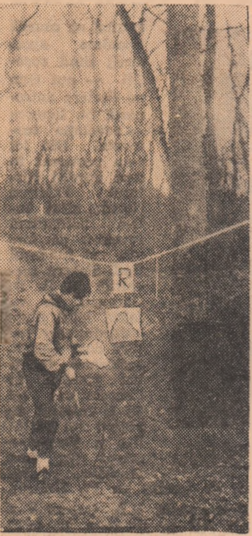
La un post de control, citeva clipe de „respiro” înainte de a continua alergarea

O participare sub nivelul așteptărilor s-a înregistrat în Cupa F.R.T.A. (etapa de iarnă) la tineret (unde s-au înscris doar 7 băieți și 6 fete) și la seniori (unde au luat startul doar... 4 concurenți). Au absentat nemotivat orien-