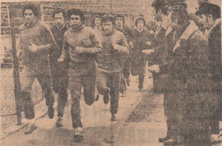
Aspect de la trecerea testelor de pregătire fizică de către jucătorii de la Dinamo București. Instantaneu surprins ieri pe stadionul Dinamo.