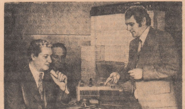
in eter este lansat un nou apel: „Aici YO4KCA — Radioclubul Constanța”.