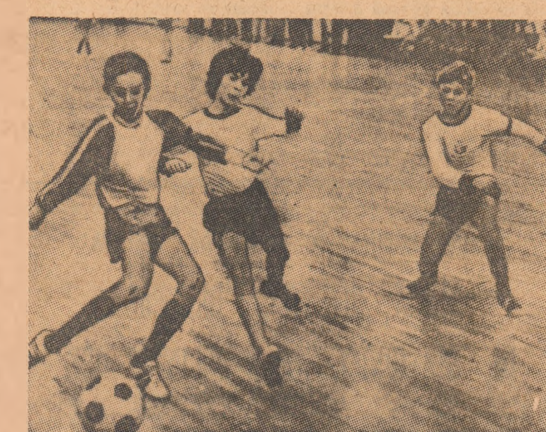
Dresden, care au dispus în finală de Post Neubrandenburg cu 2-0.

Primele partide disputate s-au încheiat cu următoarele rezultate: Peru — Columbia 102-70 (52-32); Brazilia — Venezuela 90-61 (44-28); Chile — Paraguay 77-70 (48-38).