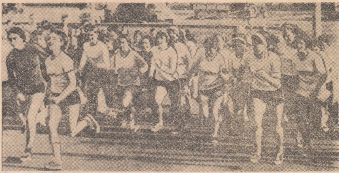
În timpul șezereii activităților sportive, elevete de la Grupul școlar textil participă, în număr mare, la cursurile organizate de asociația sportivă...