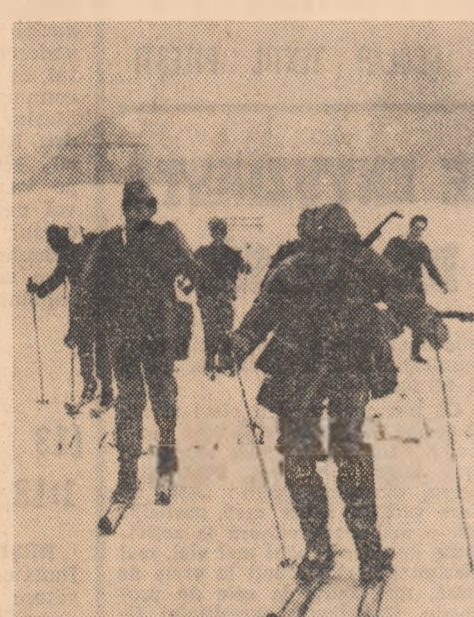
Sosirea în proba de patrulă.