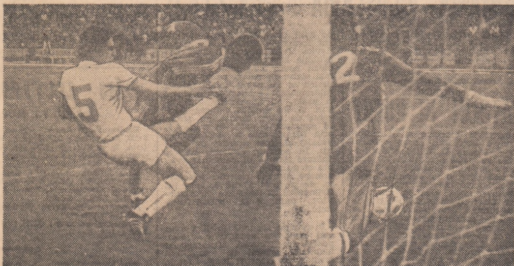
Năstase înscrie, cu capul, al doilea gol al formației Steaua. Era minutul 43 și campioana lua conducerea