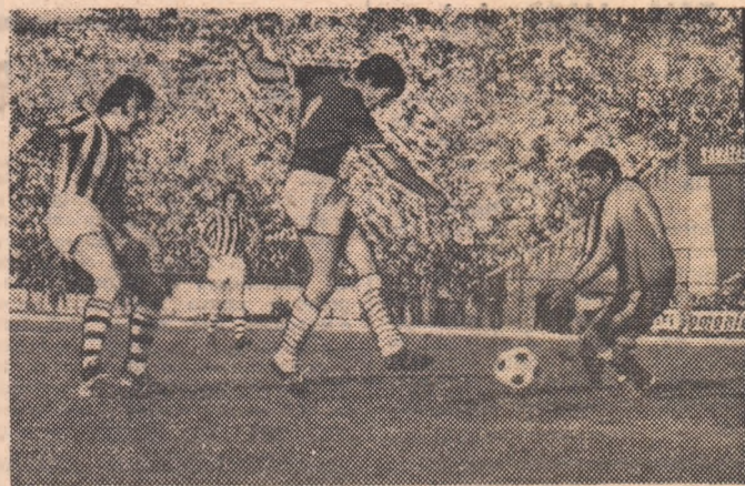
Min. 67: Tevi înscrie fără dificultate unicul gol al partidei Progresul — Sportul studențesc

În pag. 2—3, comentarii din actualitatea fotbalistică, rezultatele etapei a 17-a din Divizia C, știri din activitatea la zi.