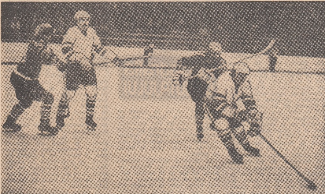
„Cupa Federației“ la hochei