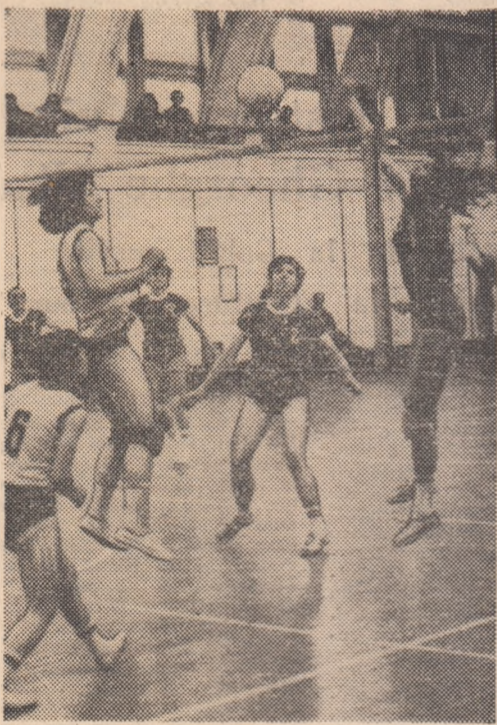
În campionatul feminin de volei s-a desfășurat ieri penultima etapă. În imagine, o fază surprinsă de fotoreporterul nostru Dragoș Neagu la partida dintre Dinamo și I.E.F.S.

● Azi vor fi desemnați campioni la patru categorii de greutate: semimijlocie (78 kg), mijlocie (86 kg), semigrea (95 kg) și grea (+95 kg) . Cele două reuniuni programate astăzi încep la orele 10 și 16.