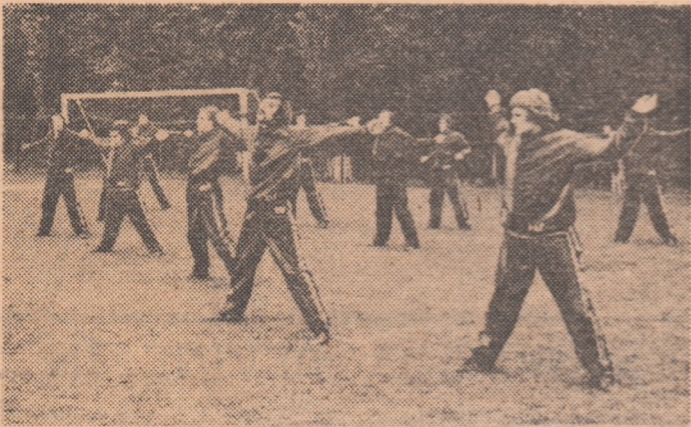
O scurtă „repriză de gimnastică” înaintea antrenamentului propriu-zis de ieri al lotului A.

Din informațiile pe care ni le-au furnizat corespondenții ziarului, pe marginea etapelor județene, reiese că disputa tinerilor, dorinca să-și dobîndească dreptul de a participa la finala competiției care se va desfășura la 2 mai în București a fost interesantă și ur-