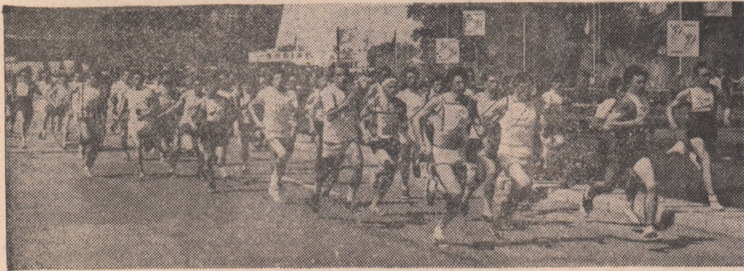
Un instantaneu din intrecerea finaliștilor la categoria peste 19 ani din cadrul „Crosului tineretului“