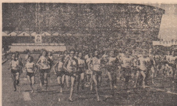
Moment din finalele „Crosului tineretului”, categoria 15-16 ani, fete