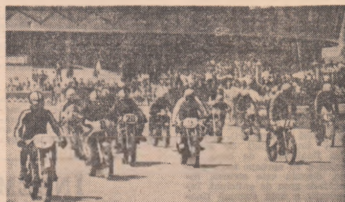
La câteva secunde după startul în întrecerea motocicletistilor

În vederea meciului de duminică, cu echipa Iugoslaviei