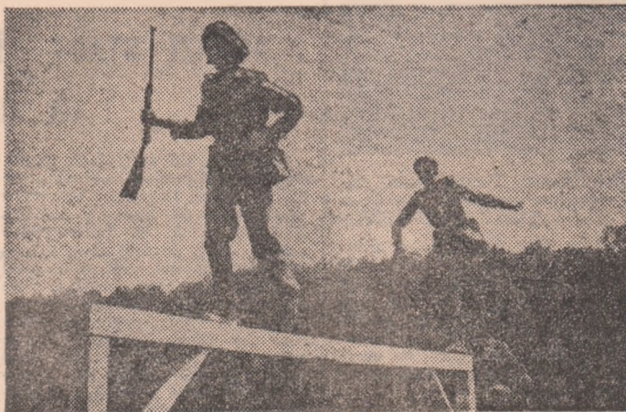
Una din probele concursului „Pentru apărarea patriei“: „pista cu obstacole“