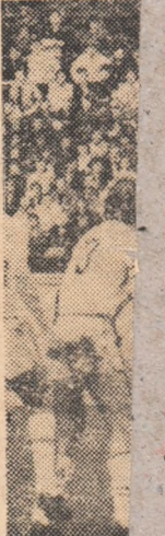
Dobru (tr al dinamov

BIHOR și-a prin eliminat joi, la Tulcea, pe C. Georg. LATI are o să joace fructuos ● LA SI TESCO se luie Sand necesar ● F.C. va putea suspendat. Găteji și H Jentași ● S acasă. F.C.M. țărștește apariția lui Poră pa trecut și nașe galben zut cum va propriu. ● Atodiresei,