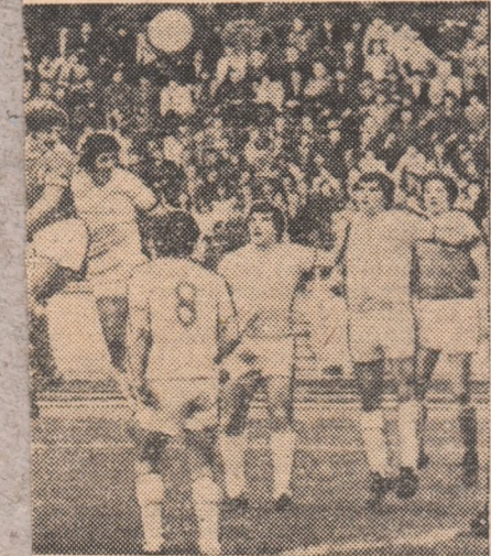
...e închisă) înscrie, cu capul, primul gol l cu Corvinul.

problemă, Băile Felix pentru tratament Popovici, folosirea M. GA- problemă: a aplau- FUDEN- aparitia atit de a sa de NTA nu Turcu, re, de acci- însă, joi, isi in- reapari- in eta- carto- de vâ- te teren absentă eca la