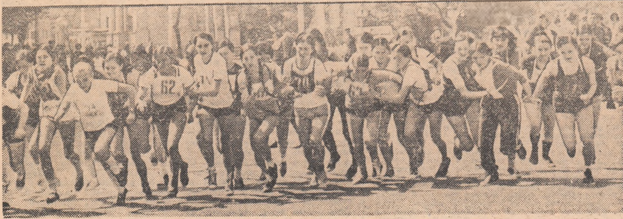
Aspect de la una din întrecerile de cros, care au avut loc în aceste zile la Tg. Mureș.