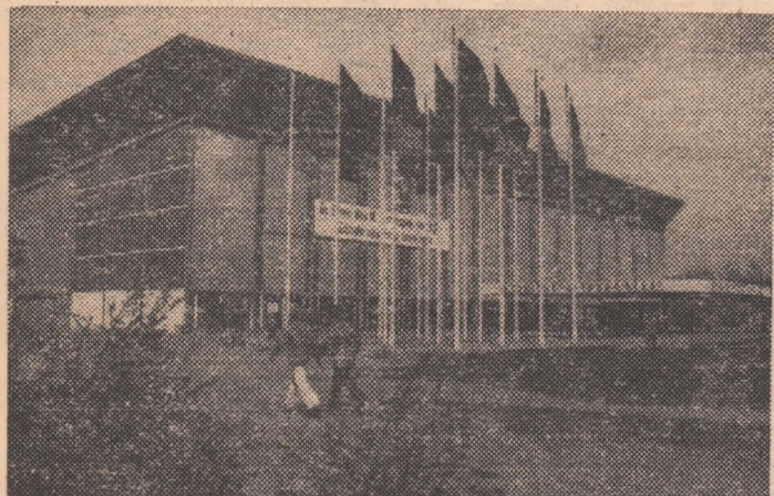
„Eissporthalle”- va găzdui C.E. de box.

Turnee de calificare pentru faza finală a campionatului european de junioare (programat în luna august în Iugoslavia) a început în orașul olandez Dokkum. În primul joc, echipa României a întrecut cu 3-2 (13, -6, -7, 9, 8) formația Olandei.