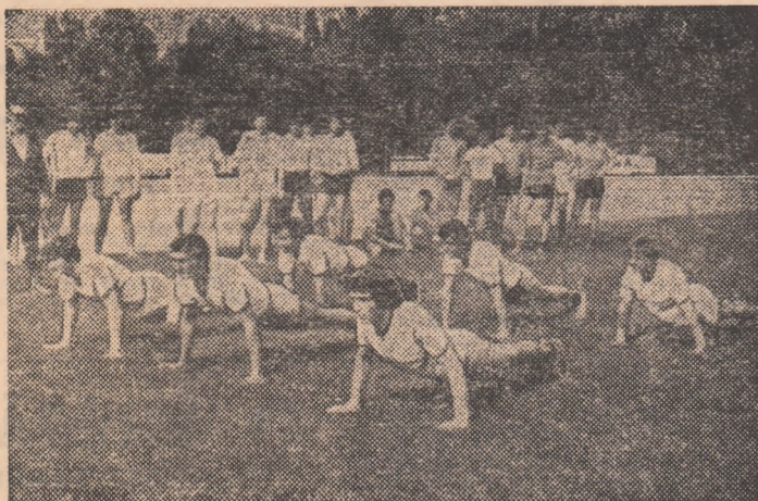
Pe stadionul Voința din Capitală, acțiune pentru trecerea normelor complexului „Sport și sănătate”

În rubrica noastră de astăzi, citeva din relatările privind aceste entuziaste manifestări care au cuprins, în diferite activități sportive, un mare număr de tineri și tinere.