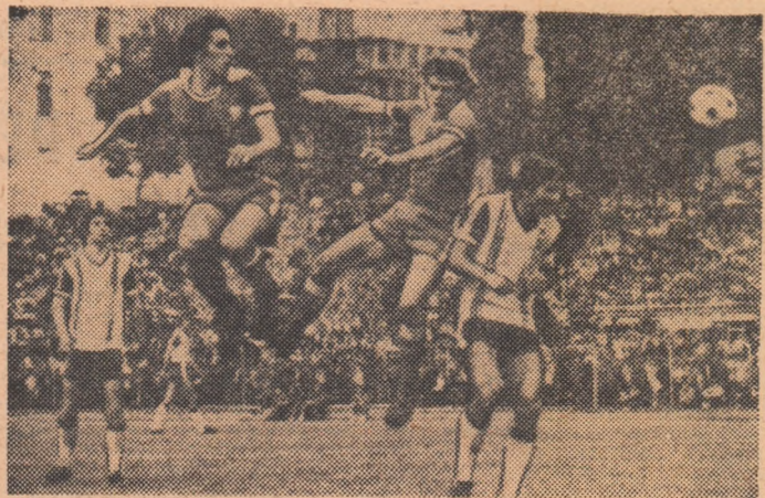
Sătmăreanu II (autorul unuia din cele două goluri) a luat puternic cu capul spre poarta lui Catona. Fază din meciul Dinamo — Politehnica Timișoara