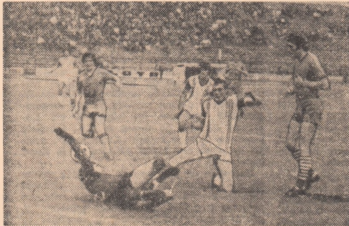
Duel între inaintașul timișorean Floareș și portarul Giron, care se va încheia cu un... aut de poartă. (Fază din meciul Politehnica Timișoara — Progresul, disputat în etapa trecută).