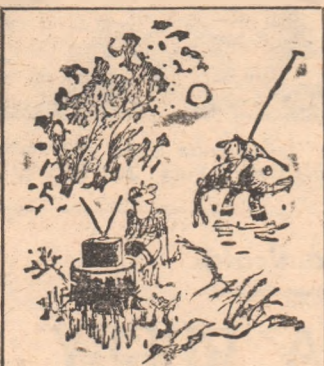
— Păcat că n-ai stat să-l vezi pe Dumitrache cum a ratat... Desen de MATTY