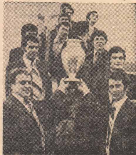
Handbaliștii de la Steaua aduc la București Cupa campionilor europeni '77, după victoria din finala cu T.S.K.A. Moscova

Sportivii de la Steaua și-au adus un aport însemnat la suc-