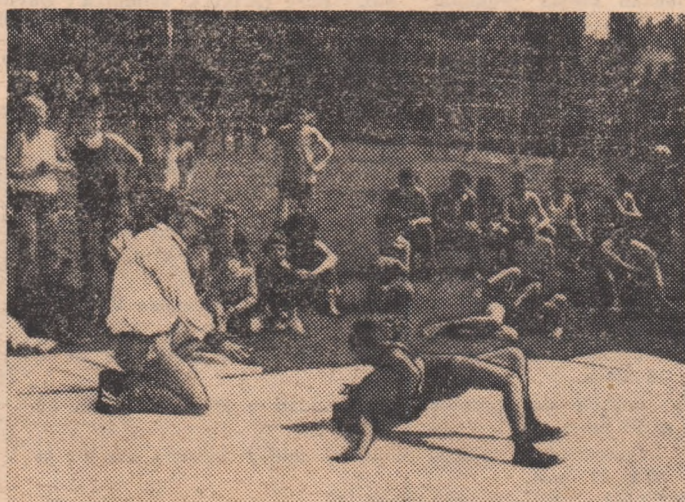
Cei mai mici luptători, pe salteaua de concurs...

Startul l-au dat concomitent handbaliștii, boxerii, scrimerii, luptătorii și jucătorii de tenis. Sute de copii și tineri din secțiile clubului Steaua, ale altor unități sportive similare (Dinamo, Rapid, Cutezătorii, Progresul, Metalul), ale unor școli sportive (Steaua, Viitorul, Energia, nr. 1 și nr. 2) au oferit frumoase partide, multe dintre ele relevând existența unor reale talente, elemente care în anii următori vor împingea efectiv cluburilor