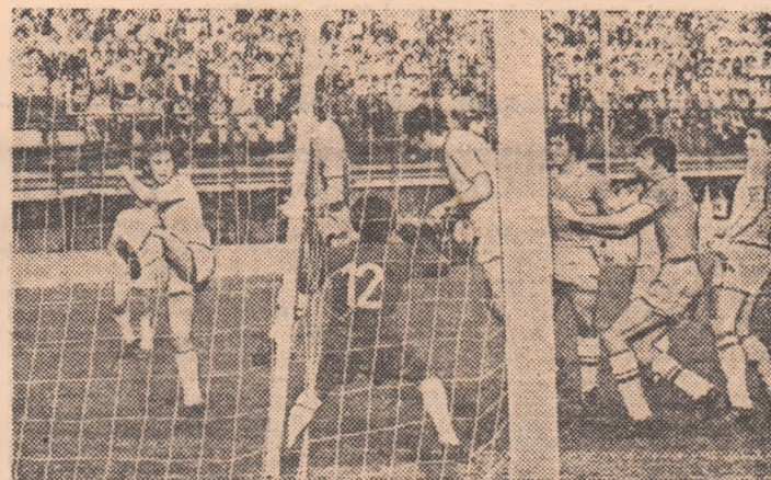
Unul din numeroasele atacuri giuleștene la poarta lui Constantinescu rămase fără rezultat. Fază din meciul Rapid — Sport club Bacău