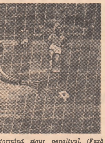
Iorgulescu deschide scorul, transformînd sigur penaltyul. (Fază din meciul Progresul - F.C.M. Reșița)

PROGRESUL - F.C. M. REȘIȚA 2-1 (1-0) Stadion Progresul; teren cu denivelări; timp frumos; spectatori - aproximativ 1.500. Au marcat: IORGULESCU (min. 14, din penalti), TEVI (min. 83), respectiv GABEL (min. 84). Raport de cornere: 9-6. Raportul șuturilor la poartă: 17-12 (pe spațiul porții: 10-7). PROGRESUL: Giron 7 - Ploscaru 6, Moraru 6, Bădea 6, Gh. Ștefan 6 - Iorgulescu 7, Nignea 6 (min. 80 Iotan), Grama 7 - I. Sandu 5 (min. 65 Fl. Mihai 5), Tevi 6, Apostol 6. F.C.M. REȘIȚA: Iliș 7 - Chivu 6, Kiss 6, Hergane 7, Boțonea 5 - Gabriel 7, Parațchi 6, Bora 6 - Atodiresel 5 (min. 46 Jacotă 6), Bojin 6, Florea 7. Arbitrat: M. Moraru ***; la linie: V. Gligorescu și N. Morelanu (toți din Ploiești). Cartonaje galbene: HERGANE, PARAȚCHI. Trefeul Petschovski: 9. La juniori: 3-0 (1-0).