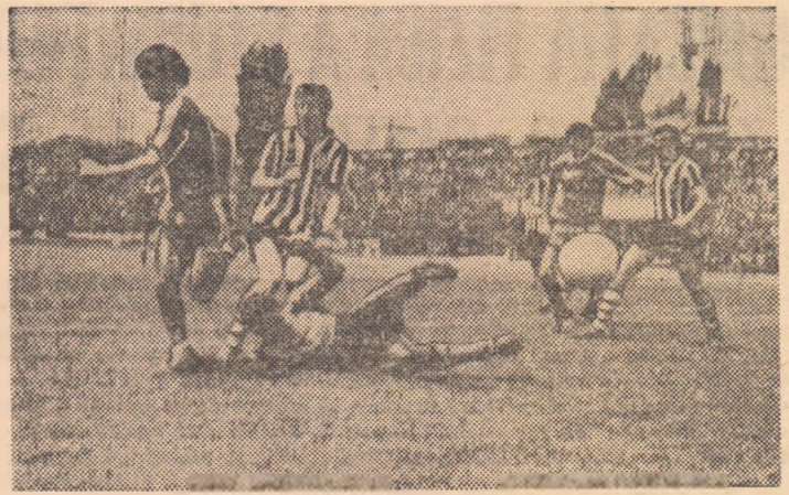
Secvență din meciul Steaua—Sportul studențesc, disputat în returul campionatului. Miine, cele două formații bucureștene vor evolua din nou pe teren propriu.

oferi, la rindul lor, Steaua și Jiul, Dinamo și Politehnica Iași. Spunem acestea având în vedere valoarea gazdelor, dar și forma oaspeților, în acest sezon. Meciuri echilibrate la Oradea și Pitești, pentru că F. C. Bihor n-a mai cunoscut victoria de patru etape, iar adversarul său vine după succesul din Giulești, în timp ce F. C. Argeș reareare după două etape nesperate de bogate pentru ea, prin victoria de la Reșița și succesul de miercuri, acasă, asupra Stelei. Singurul meci fără nici o problemă pare să fie cel de la Craiova. Și acolo, însă, există premise pentru un fotbal spectaculos. Gazdele, datorită locului și lotului, iar oaspeții, nemaivind ce pierde, au șansa de a juca deschis și sportiv. Vrem să credem că meciurile de miine vor avea drept numitor comun fair-playul.