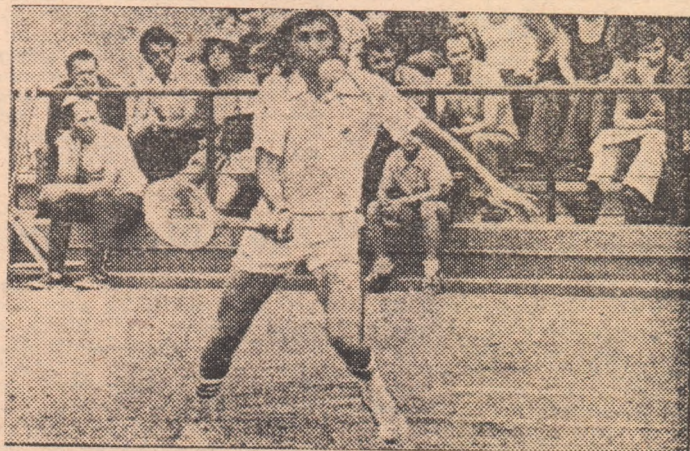
Ilie Năstase returnează o minge de la linia de fund, în finalul partidei sale cu John Feaver.

Așa cum era de prevăzut încă de la început, John Feaver n-a vrut să intre nicî un moment în rolul unui „învingător”, în fața puternicului său adversar. Chiar și atunci cînd Ilie Năstase se distanța, cu destulă ușurință, la 5-0 în primul set și 5-1 în al doilea. Primul nostru jucător a fost stăpîn autoritar în acest început de partidă, în care a servit „ași” în serie (au fost 19 în total!), a