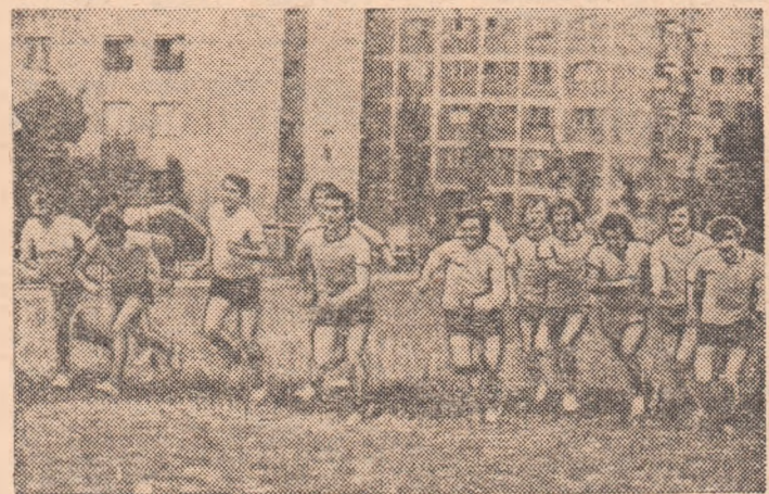
Alergările de cros, una din numeroasele pasiuni sportive ale tinerilor de la „Aurora”