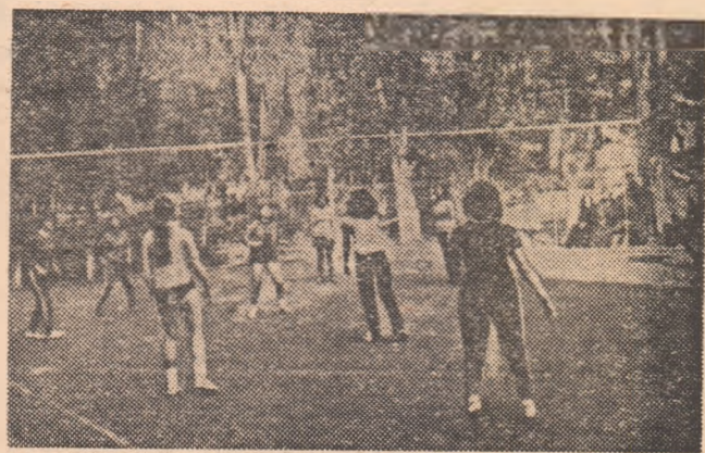
Competiția de masă „Cupa Femina” a prilejuit amatoarelor de sport din Hunedoara participarea la atractive întreceri. În imagine, o fază de la meciul de volei dintre reprezentantele asociațiilor Sănătatea și Voința, desfășurat pe terenul Grupului școlar siderurgic.

Peste 90% dintre studenți și-au trecut normele!