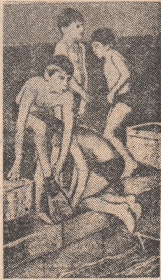
Micii înotători, înaintea primelor starturi

În capitala Ungariei, ca și în alte orașe, se acordă o atenție deosebită învățării înotului de către copii. Acțiunea aceasta de masă a început de fapt cu aproape 20 de ani în urmă, dar în ultima vreme ea a luat o amploare deosebită.