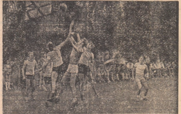
Duminică, pe stadionul Tineretului. În bogatul program al întrecerilor școlare, meciul de baschet dintre echipele Liceului Industrial nr. 4 și Liceul nr. 11.