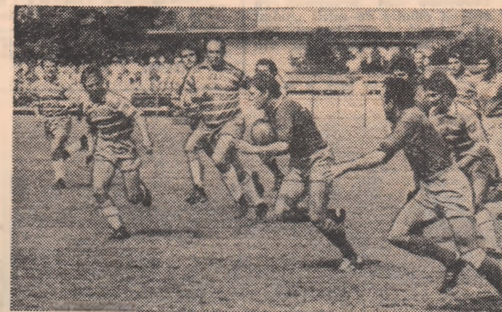
La derbyul Steaua - Farul, rugbyștii militari s-au impus mai eficient în partea a doua a meciului, cîștigînd la scor.