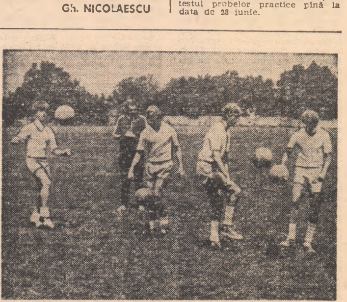
Secvență cu patru dintre candidații la examenul pentru clasa a VIII-a. Proba practică — menținerea balonului în aer. 18 lovituri pentru nota 10. Examinator — M. Rotărăscu.

Liceul de fotbal Pajura a hotărît să prelungească perioada de înscriere (pentru clasa a IX-a) la testul probelor practice pînă la data de 28 iunie.