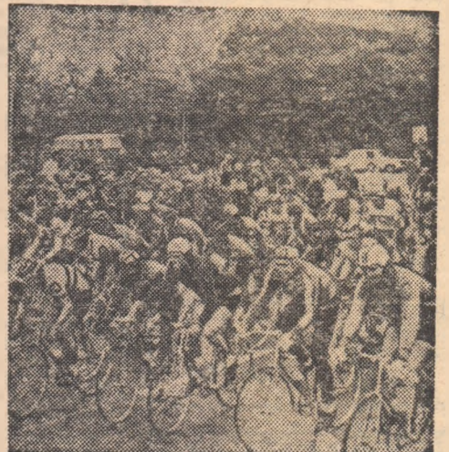
Caravana „Cursei Păcii” (echipa Cehoslovaciei a ocupat locul III la această ediție) la start.

În cele câteva ore în care caravana ciclistă a făcut popas, am asistat la încîntătoare serbări sportive, în care capul