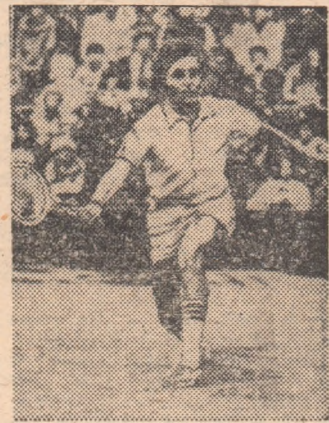
Ilie Năstase, pe faimosul gazon londonez

LONDRA, 21. — Turneul de tenis de la Wimbledon a continuat ieri cu primele partide ale probei de simplu femei. Cișgițăloarea de anul trecut,