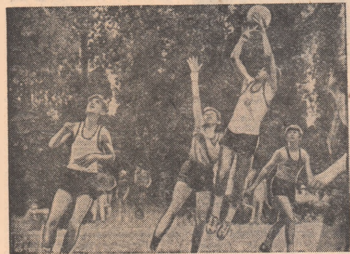
În derbyul Șc. sp. 3 Steaua — Șc. sp. 1 Constanța, au abundat aruncările la coș spectaculoase, așa cum se vede și în imaginea de mai sus