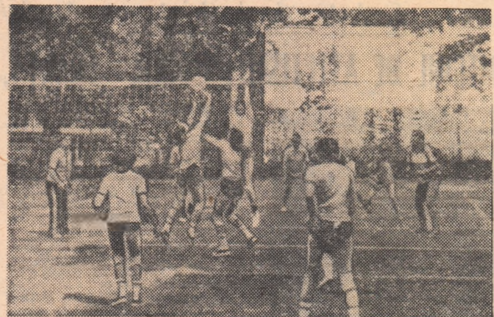
Una dintre echipe va pierde, dar toate aceste tinere vor avea de cîștigat de pe urma sportului.