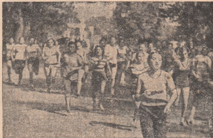
Intrecere de cros sau alergare după... sănătate!

● Fruntașe în muncă și în sport la „Festivalul fetelor argeșene”