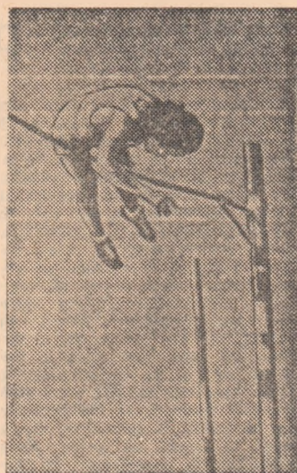
Jean Michel Bellot în momentul săriturii de 5,50 m la prăjină (record francez)