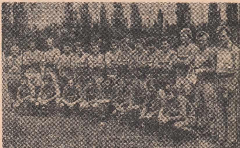
Rugbyștii Stelei la câteva momente după îmbrăcarea tricourilor de campioni

REZULTATELE TEHNICE ale ultimei etape (turneul final). SERIA I: C.S.M. Sibiu - Știința Petroșani 6-6 (6-6); Dinamo - Steaua 27-22 (9-16); Farul Constanța - Politehnica Iași 23-6 (10-0); Ruimentul Biriad - Grivița Roșie 9-0 (3-0); SERIA a II-a: Rapid - Sportul studențesc 20-6 (6-0); Olimpia Buc - Gloria Buzău 49-15 (13-3); Gloria Buc. - Universitatea Timișoara 24-30 (4-14).