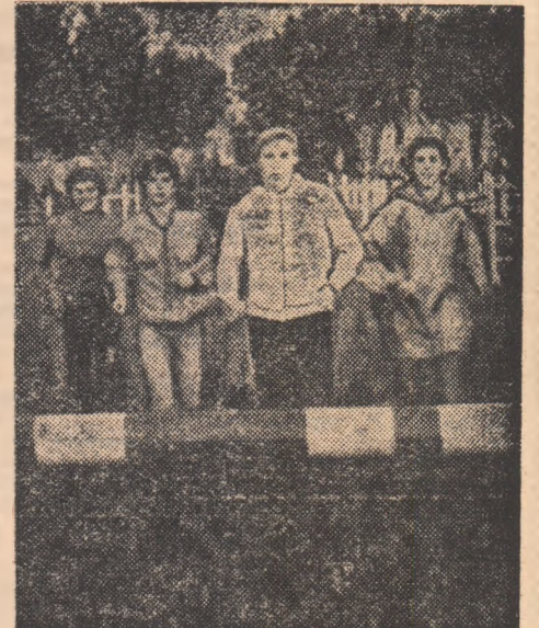
Aspect de la pregătirea fizică efectuată ieri de pentatloniștii români