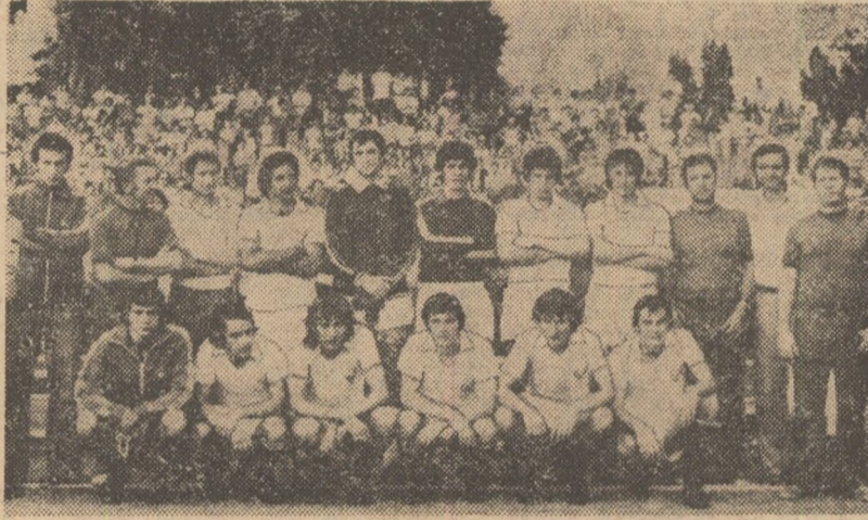
Echipa DINAMO BUCUREȘTI, câștigătoare a titlului de campion pe 1976-77

● Dinamo, Steaua, Universitatea Craiova și A.S.A. ne vor reprezenta în cupele europene ● Rapid (împreună cu F.C.M. Galați și Progresul) reia drumul Diviziei B... ● Dudu Georgescu (5) + Lața (3) = 8 goluri