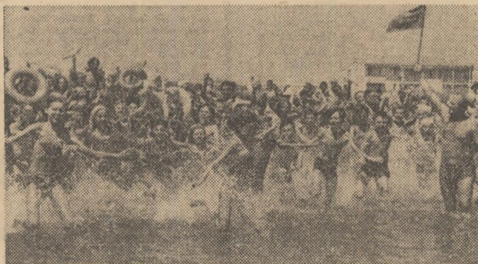
O secvență de sezon a fost surprinsă la Năvodari, unde zeci de mii de copii, pionieri și școlari vor trăi din plin bucuriile întâlnirii (sau reîntâlnirii) cu Marea...

În marea vacanță a elevilor (într-o primă etapă, a celor din clasele I-VIII, iar după 15 iulie și a celor din școlile tehnice, profesionale și din licee, aflați acum în practica de producție), peste 2,5 milioane de șoimi ai patriei, pionieri și școlari vor fi beneficiarii unor