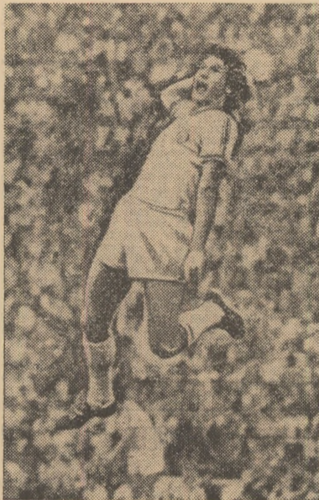
Liderul marcatorilor europeni, Dudu Georgescu - 47 de goluri și a doua „Gheată de aur”

În urmă cu 10 ani, când lipsa de eficacitate a echipelor de fotbal din Europa producea multe discuții, specialiștii ai continentului nostru căutau diferite soluții practice pentru a depăși această criză a „golorilor”. Cu timpul, „betonul” a fost strâpuns... Unele corectări aduse regulamentelor de desfășurare a competițiilor pe plan european și național au avut drept scop stimularea jocului ofensiv, în ultima analiză a eficacității. Printre aceste măsuri, vom aminti că U.E.F.A. a legiferat - pentru cupele europene - dublarea golorilor marcate în deplasare (în cazul când scorul general este egal, după două partide). Același fapt a hotărât aplicarea regulii ca în clasamentele oficiale, la puncte egale, departajarea să se facă prin diferența dintre golurile marcate și cele primite (adică prin scădere și nu prin împărțire), metodă adoptată acum în majoritatea campionatelor naționale; în sfârșit, „bonus”-ul acordat, un timp, în campionatul francez pentru victorii la scoruri mai mari de 2-0.