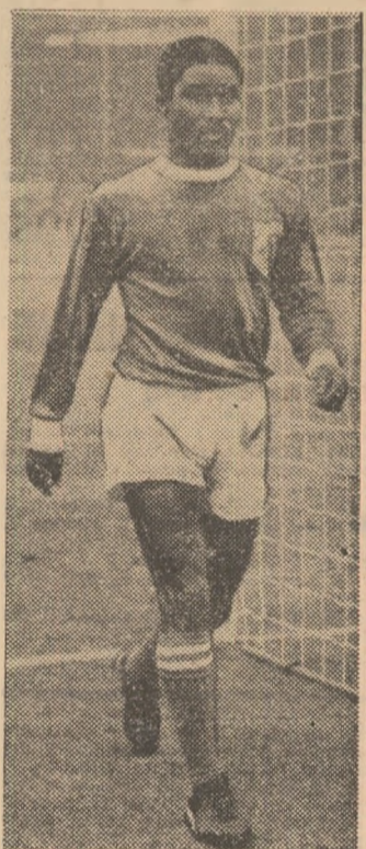
Primul câștigător al „Ghetei de aur”: Eusebio

De 10 ani, asistăm la o luptă pasionantă în această întrecere de anvergură, care preocupă nu numai pe jucători, ci pe toți iubitorii balonului rotund din Europa. Printre câștigătorii trofeului se află cîteva mari vedete