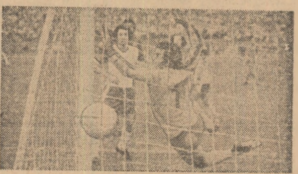
Fl. Marin reduce handicapul.