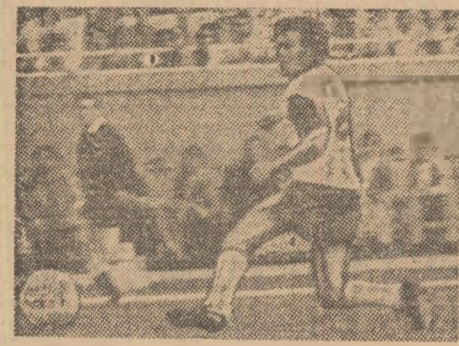
Balaci deschide scorul, la capătul unui sprint irezistibil. Minutul 78: Fl. Marin reduce handicapul