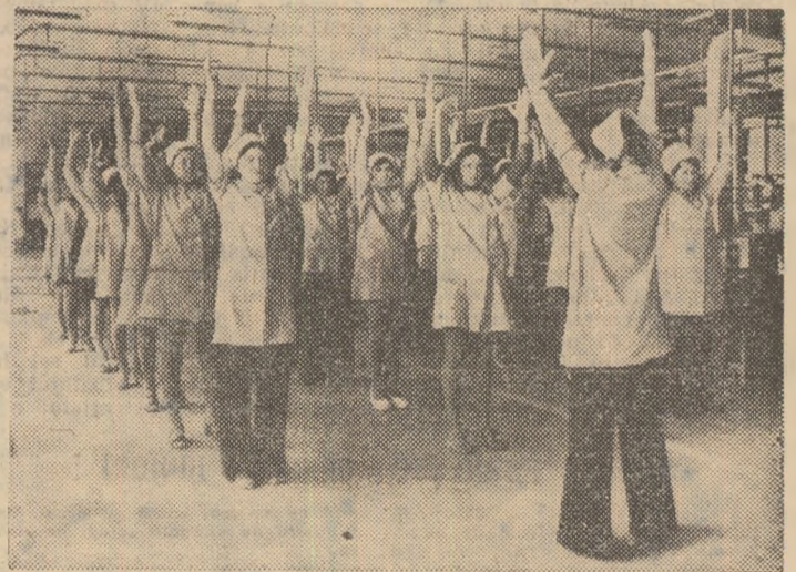
Gimnastică în secția bobinaj a întreprinderii Tehnoton din Iași.

● În județul Iași gimnastica la locul de muncă se practică în 7 unități din ramura industriei ușoare, 2 din cea a chimiei, 1 din industria construcțiilor de mașini, 1 din ramura industriei alimentare. ● Cu sprijinul studioului de radio Iași au fost înregistrate pe bandă magnetică complexe de exerciții pentru fiecare întreprindere în parte. ● Pentru generalizarea gimnasticii Consiliul județean al sindicatelor, în colaborare cu C.J.E.F.S. a organizat schimburi de experiență la întreprinderile „Moldova” și „Tehnoton”. ● La sfârșitul lunii iunie, în județul Iași erau angrenați în practicarea gimnasticii la locul de muncă 11.500 de angajați.