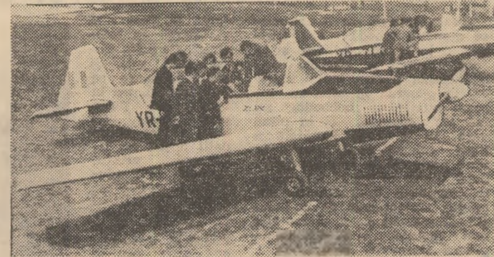
În aeroclubul „Aurel Vlaicu” București, aspiranții la brevetul de pilot fac prima cunoștință cu aparatele de zburat.

în bune condiții a acestor sarcini constituie o preocupare deosebită a Comitetului județean U.T.C. S-a desfășurat, în acest sens, o amplă muncă de pregătire preliminară a viitorilor aviatori sportivi. În cadrul aerocercușilor care fi înțază în licee și școli, s-a făcut selecția celor cu aptitudini deosebite pentru aceste sporturi, astfel că este așteptată cu emoție ziua deschiderii oficiale. De altfel, numeroși dintre viitorii elevi ai „școlii curajului” au și făcut cu încredință cu turnul de parașutism — de la deschiderea sezonului au fost executate aici peste 800 de