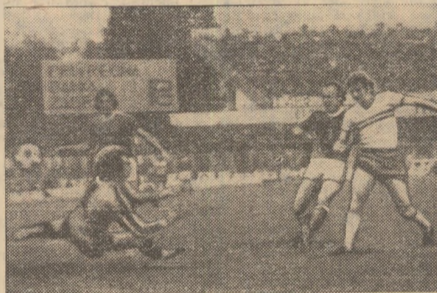
Dudu Georgescu a înscris 47 de goluri în campionat, dar cel mai frumos dintre toate va rămîne al... 48-lea, adică cel înscris la Zagreb, în ziua de 8 mai

Ediția 1976-1977 rămîne o ediție interesantă, care are pe fronthorizont cele patru puncte din patru ale echipei naționale, dar care nu reușește să steargă cu desăvîrșire amintirea startului — ca întotdeauna slab — al echipelor noastre în cupele europene, așa cum s-a întimplat în toamna lui 1976. Să sperăm că noua ediție, a 60-a, va reuși să asigure atmosfera de muncă și de dăruire necesară împlinirii visului de decenii al tuturor echipelor naționale din întreaga lume: calificarea în turneul final al campionatului mondial.